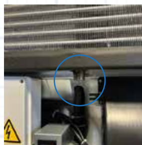
Attacco per lo scarico diretto della condensa